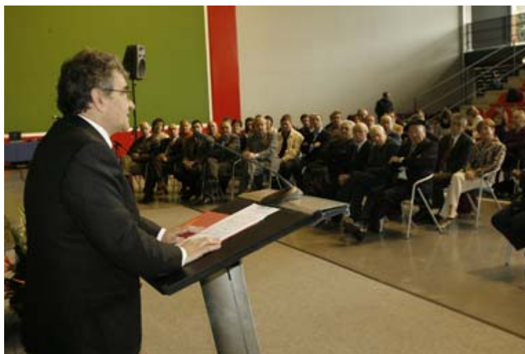
Asteasuko Usarrabi kiroldgian, 2007-III-17an; Jose Irazu “Bernardo Atxaga” sarrera-hitzaldia irakurtzen.