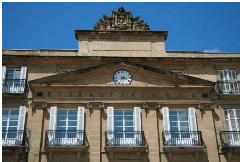
Bilbon, Plaza Barrian, Euskaltzaindiaren egoitza.

Bilboko Plaza Barrian du Euskaltzaindiak egoitza. Bertatik eramaten dira azpiegiturazko koordinazio lanak eta hor kokatzen dira eremu honi lotuta dauden zerbitzuak: Argitalpen eta Banaketa zerbitzua, batzordeen koordinazioa, Prentsa eta Komunikazioa, Informatika, Azkue Biblioteka eta Kontularitza. Egoitzan kokatzen da Akademiaren Zuzendaritza ere.