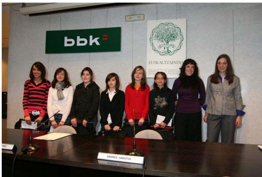
Egoitzan, 2008-III-12an; 2007ko Azkue sarien irabazleak.

Hauek izan dira Azkue Sarietako epaimahaikoak: