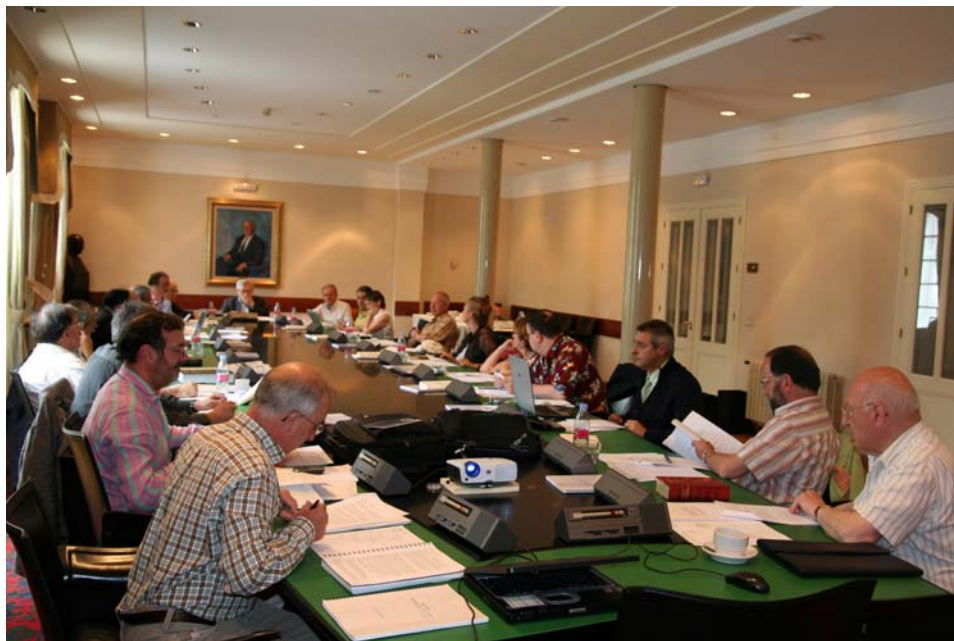
Egoitzan, 2007-VII-20an, Euskaltzaindiaren hileko batzarra.

Bilbon egin ohi dira hileroko osoen bilkurak eta Zuzendaritzakoak, nahiz eta Donostian ere tartekatzen diren. Aipatutako bilera horiez gain, batzorde eta lantalde bilera hauek egin dituzte: Gramatika batzordea, Donostian; Herri Literatura, Donostian; Literatura Ikerketa, Donostian eta Baionan; Dialektologia-Atlasgintza, Bilbon; Hiztegi Batuko lantaldea, Donostian; Corpus batzordea, Donostian; Sustapen batzordea, Donostian, Argantzunen eta Vianan; Euskalkien lantaldea, Donostian; Onomastika batzordea, Donostian, Ziordian, Oiartzunen, Vianan, Altsasun eta Argantzunen; Exonomastika batzordea, Bilbon eta Donostian; Informatika eta Komunikazio Teknologia batzordea, Bilbon eta Donostian; XVI. Biltzarraren batzordea, Donostian eta Bilbon; Argitalpen eta Azkue Bibliotekako batzordeak, Bilbon.