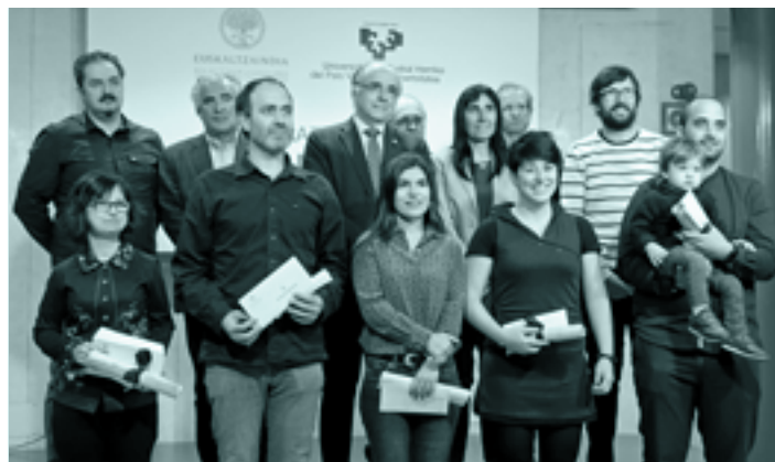
Maiatzean banatutako Koldo Mitxelena Sarien irabazleak