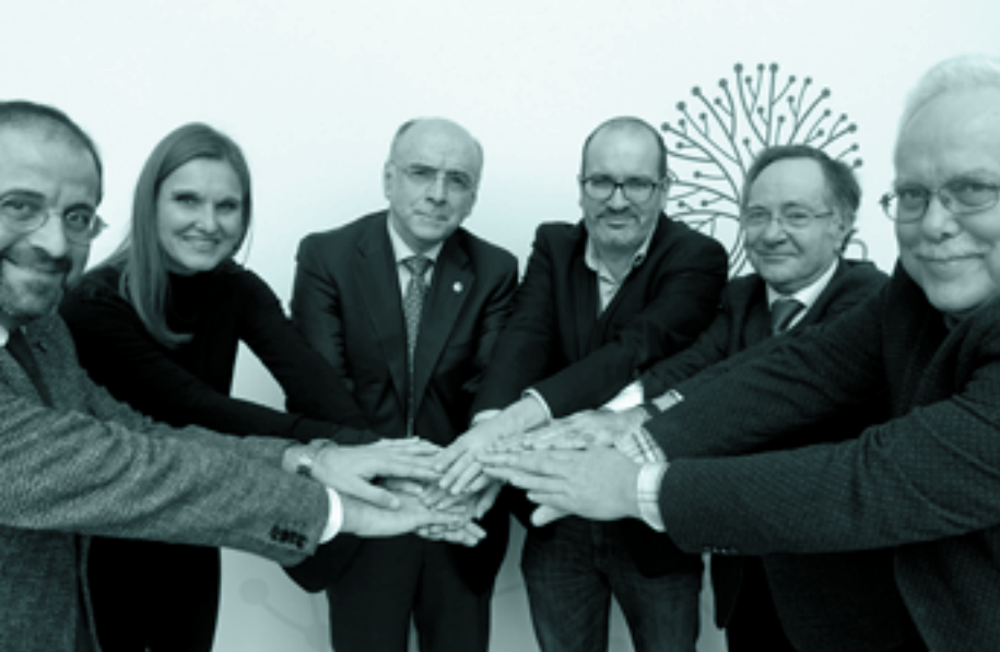
Hizkuntza gutxiagotuen hiztunen eskubideak defendatzeko ituna