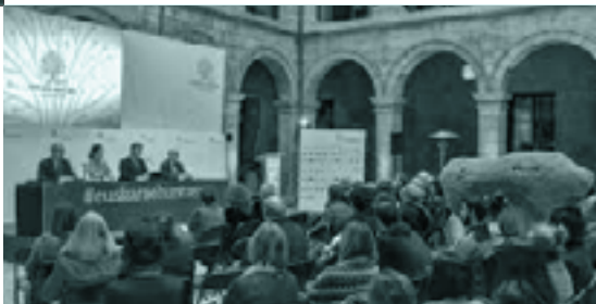
Martxoan, Bilbon, dialektologiari buruz egindako jardunaldi akademikoaren hasiera ekitaldia