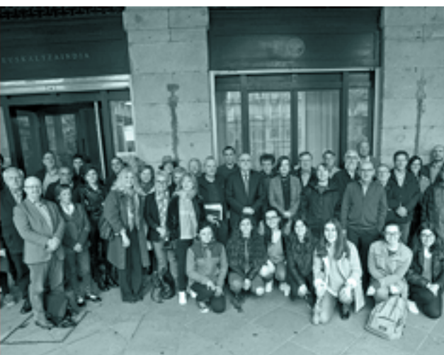
Maiatzean, Bilbon, literaturari buruz egindako jardunaldi akademikoa