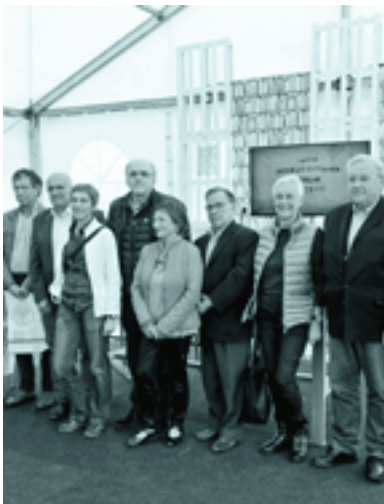
Euskaltzaindiaren azken argitalpenen aurkezpena Sarako Idazleen Biltzarrean