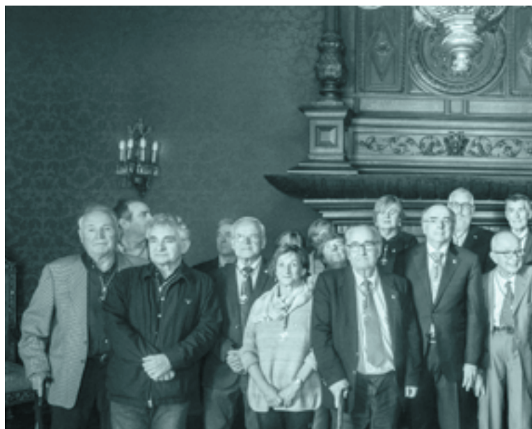
Mendeurrenaren amaiera ekitaldia urrian, Donostian

Amaiera ekitaldiaz gain, Euskaltzaindiak beste zortzi ekitaldi instituzional egin ditu 2019an, Mendeurrenaren baitan: jardunaldi akademiko bakoitzaren hasiera-ekitaldiak, hain zuzen ere.