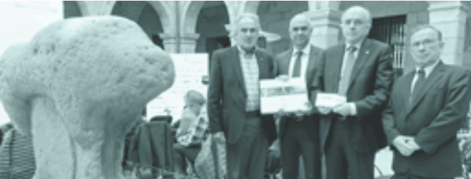
Martxoan, Euskararen Herri Hizkeren Atlasaren X. liburukia - aurkezpena.