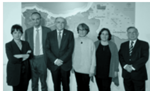
Euskara ibiltaria erakusketa berritua