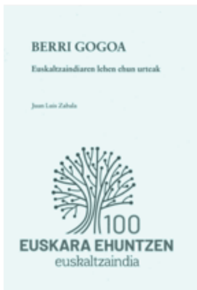
Berri gogoa liburuaren azala