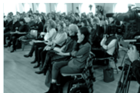
Otsailean, Gasteizen egindako jardunaldi akademikoa

[...] Kako artean daudenak Mendeurrenari lotutako ekimenak dira