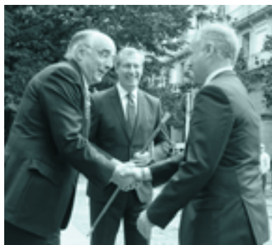
Mendeurrenaren amaiera ekitaldia urrian, Donostian