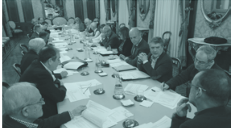
Otsailean, Iruñean egindako osoko bilkura