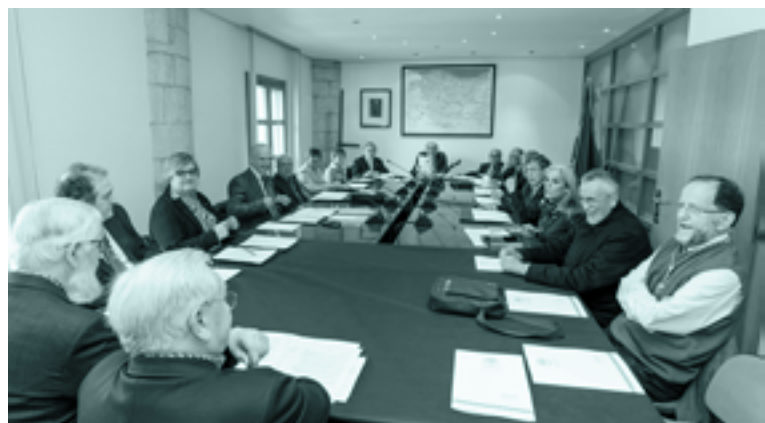
Martxoan, Aretxabaetan egindako osoko bilkura