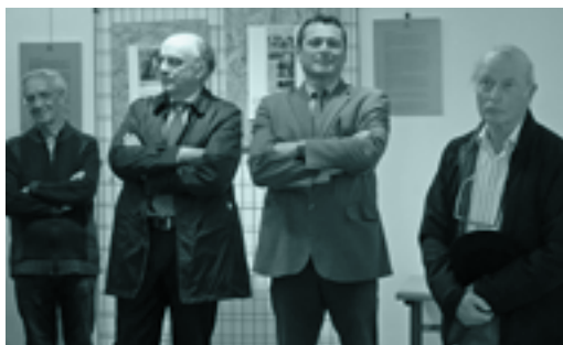
Baiona, 1964: euskara batuaren zedarria erakusketa