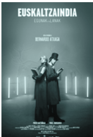
Dokumentala iragartzeko kartela