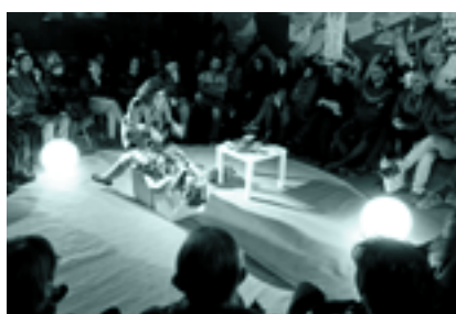
Lautan Hiru antzerki festibala