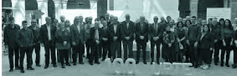
Martxoan, Bilbon, dialektologiari buruz egindako jardunaldi akademikoa