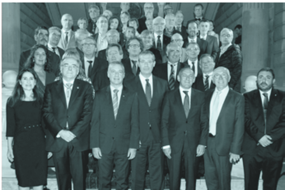
Mendeurrenaren amaiera ekitaldia urrian, Donostian