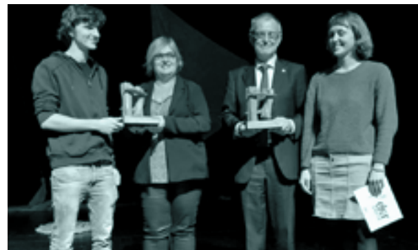
Maiatzean, Elkar Saria jasotzeko ekitaldia