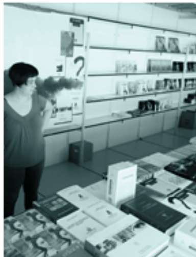
Euskaltzaindiaren saltokia Bilboko Liburu Azokan

Euskaltzaindiak Bilboko 49. Liburu Azokan parte hartu du eta Akademiaren saltokian bere azken argitalpenak egon dira ikusgai. 2019an, emakumezkoen lanak ikusarazteko ahalegin berezia egin du Euskadiko Liburu Ganberak.