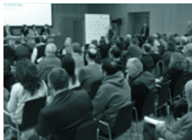
Urtarrilean, Iruñean, hizkuntza gutxiagotutako jakotari buruz egindako jardunaldi akademikoaren hasiera ekitaldia