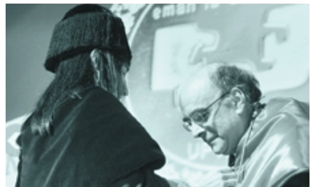
Urriari, UPV/EHUko Urrezko Domina jasotzeko ekitaldia