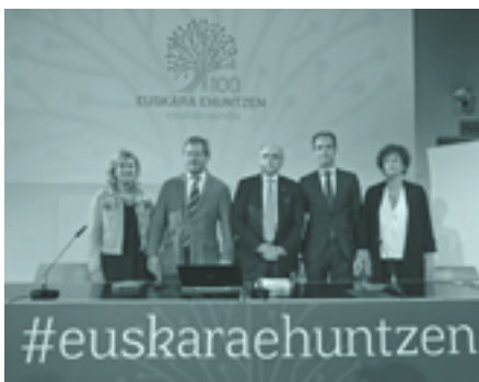
Irailan, Donostian, hizkuntzen estandarizazioa eta ingurune digitalari buruz egindako jardunaldi akademikoaren hasiera ekitaldia