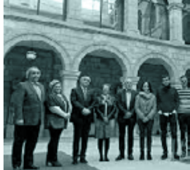
Martxoan, Bilbon, dialektologiari buruz egindako jardunaldi akademikoaren hasiera ekitaldia