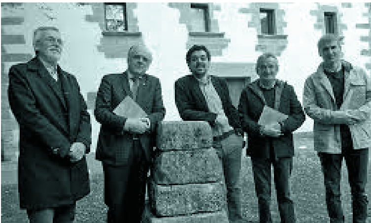
Apirilean, La Vasconia peninsular en las fuentes árabes (años 711-929) liburuaren aurkezpena

- Joanes Etxeberri egitasmoak zenbait euskal udalerritan egin diren soziolinguistika historikoari buruzko hainbat ikerketatan parte hartu du (Zumaia eta Zestoa).