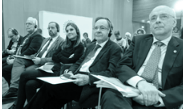
Urtarrilean, Iruñean, hizkuntza gutxiagotuak jagoteari buruz egindako jardunaldi akademikoa