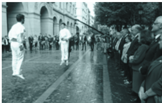
Mendeurrenaren amaiera ekitaldia urrian, Donostian