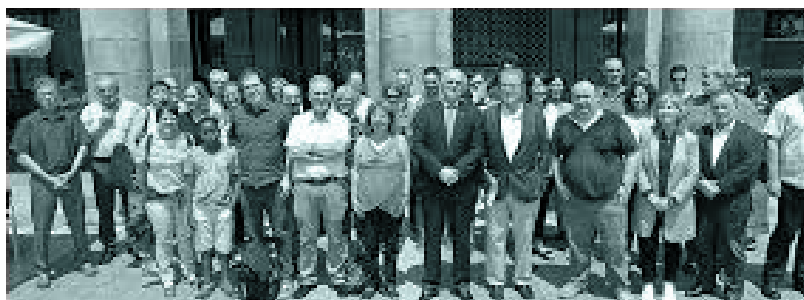
Uztailen, Bilbon, Euskal Hiztegi Historiko-Etimologikoa aurkezteko egindako jardunaldi akademikoa