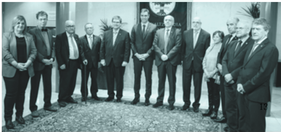
Martxoan, Pedro Sanchez Espainiako gobernuburuaren bisita