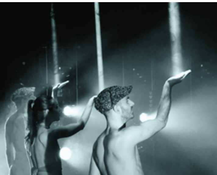
BizHitza dantza ikuskizuna