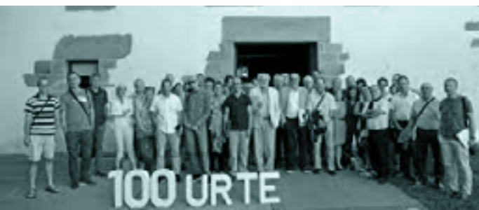
Uztailen, Donostian, gramatikari buruz egindako jardunaldi akademikoa