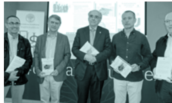
Uztailean, Kale izenen eskuliburua - aurkezpena

- Kale-izenen eskuliburua . Onomastika batzordeak 1999tik 2018ra bitartean emandako 6.300 kale-izenen datu-basea ustiaturuz, kale-izenak emateko irizpideak eztatbaidatu dira eta eskuliburua prestatu da. Liburua ekainean argitaratu da euskaraz, gaztelaniaz eta frantsesez, eta Nazioarteko Onomastika jardunaldian aurkeztu da.