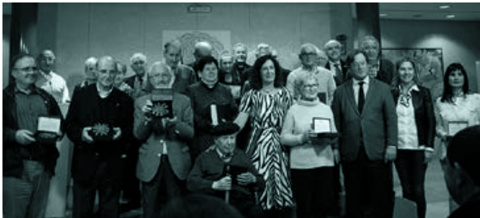
Martxoan, liturgiako euskaratzaileei ekarpena