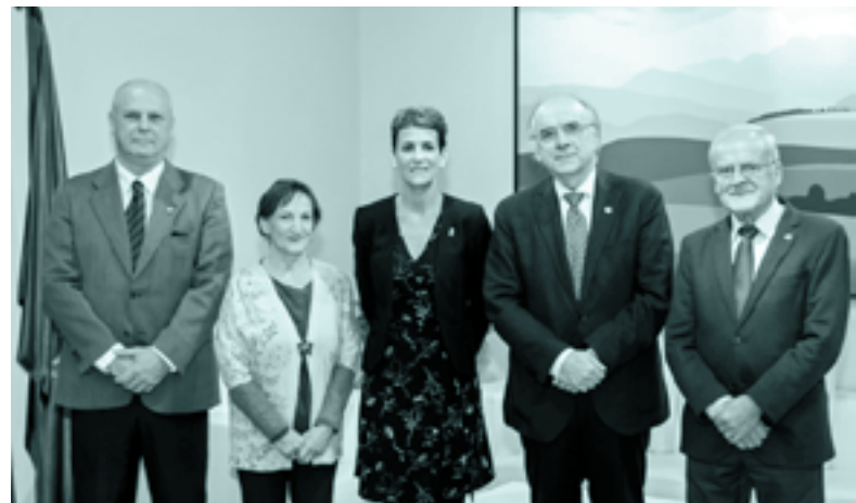
Abenduan, María Chivite Nafarroako lehendakariarekin bilera