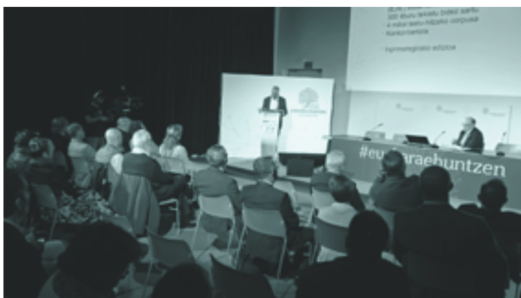
Irailean, Donostian, hizkuntzen estandarizazioa eta ingurune digitalari buruz egindako jardunaldi akademikoa