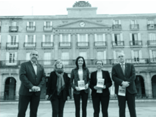
Maiatzean, Bilbon, literaturari buruz egindako jardunaldi akademikoaren aurkezpena

Bestetik, [Idazkien eta hizkuntzen arteko itzulpena: eskuizkribuak, inprimakiak, literatura-artxiboak] Euskaltzaindiaren nazioarteko literatura jardunaldia egin da 2019ko maiatzaren 16an eta 17an, Bilbon, Euskaltzaindiaren egoitzan]. Informazio gehiago hemen .