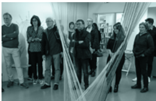
Baiona, 1964: euskara batuaren zedarria erakusketa