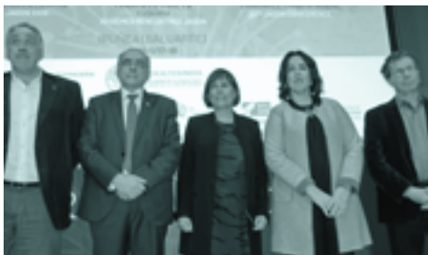
Urtarrilean, Iruñean, hizkuntza gutxiagotutako jakotari buruz egindako jardunaldi akademikoaren hasiera ekitaldia