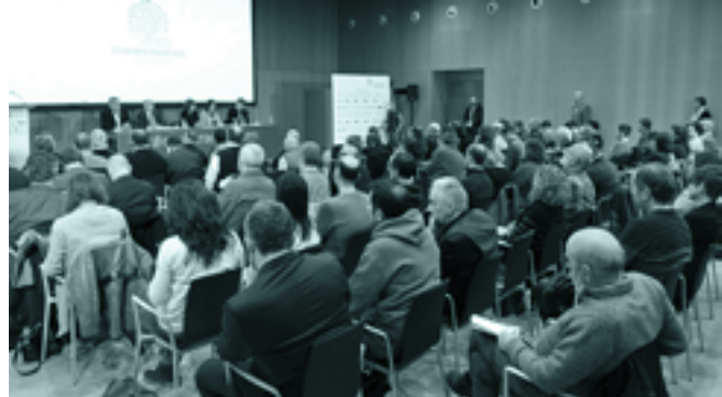
Urtarrilean, Iruñean, hizkuntza gutxiagotuak jagoteari buruz egindako jardunaldi akademikoa