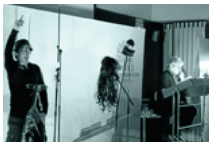
Hitzaldia euskal literatura zaharrari buruz Martuteneko kartzelan irakurraldi dramatizatuak