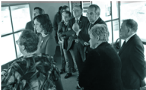
Euskara ibiltaria erakusketa berritua