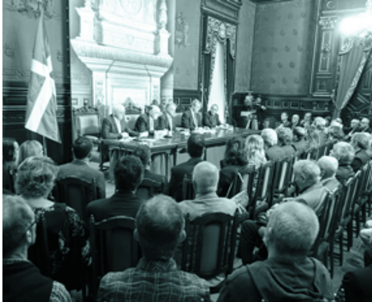
Mendeurrenaren amaiera ekitaldia urrian, Donostian