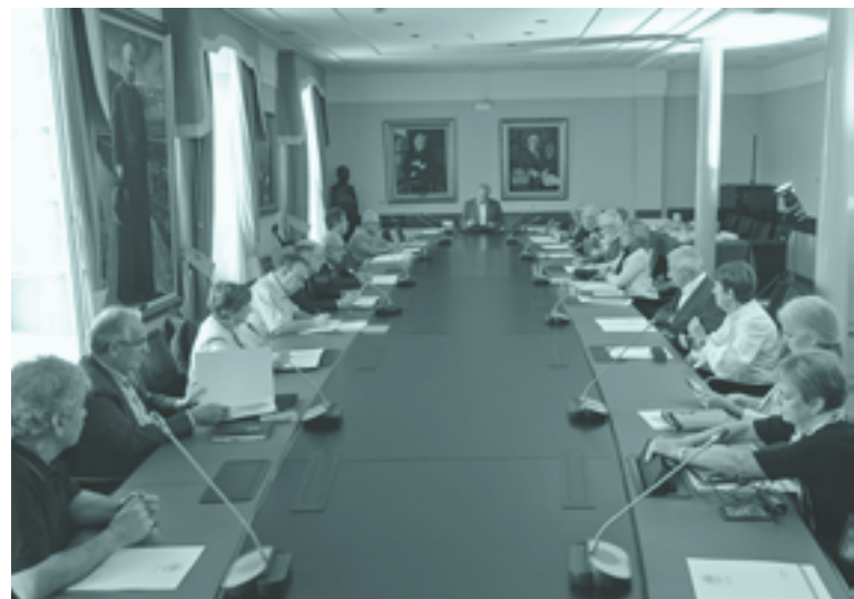
Uztailen, Euskaltzaindiaren egoitzan egindako osoko bilkura

Zuzendaritza batzordea, oro har, hamabostean behin biltzen da. Zuzendaritzako kideak ondoko hauek dira: euskaltzainburua, euskaltzainburuordea, idazkaria, diruzaina eta Iker eta Jagon sailetako buruak. Horiekin batera partaideak dira kudeatzailea eta idazkariordea, estatutuek eta barne arauak ezartzen duten moduan. Haien zeregina da Euskaltzaindiaren jardunbide ona bermatzea. Kudeatzaileak eta idazkariordeak, jorratu beharreko gaien arabera, arduradun bakoitzarekiko koordinazio-lanak bideratzen dituzte.