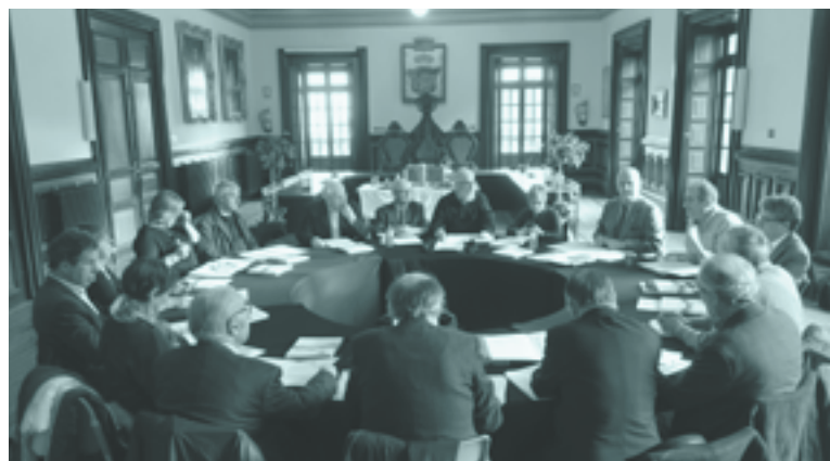
Abenduan, Lekeition egindako osoko bilkura