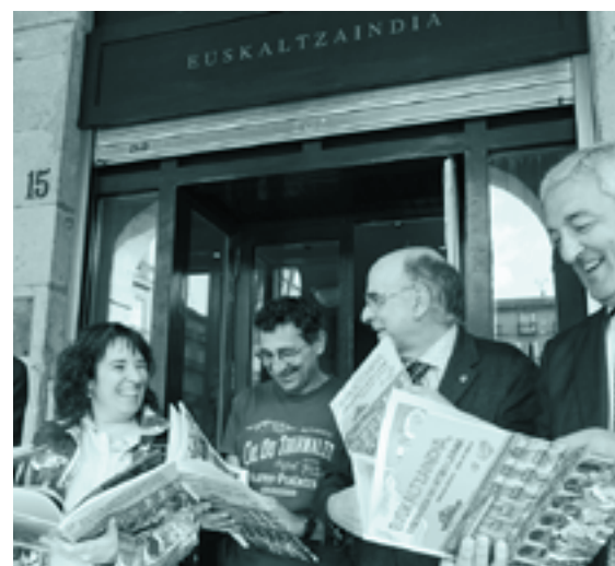
Euskaltzaindia, euskararen 100 urteko laguna komikiaren aurkezpena