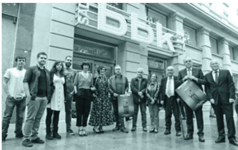
Euskaltzaindia: egunak eta lanak dokumentalaren aurkezpena