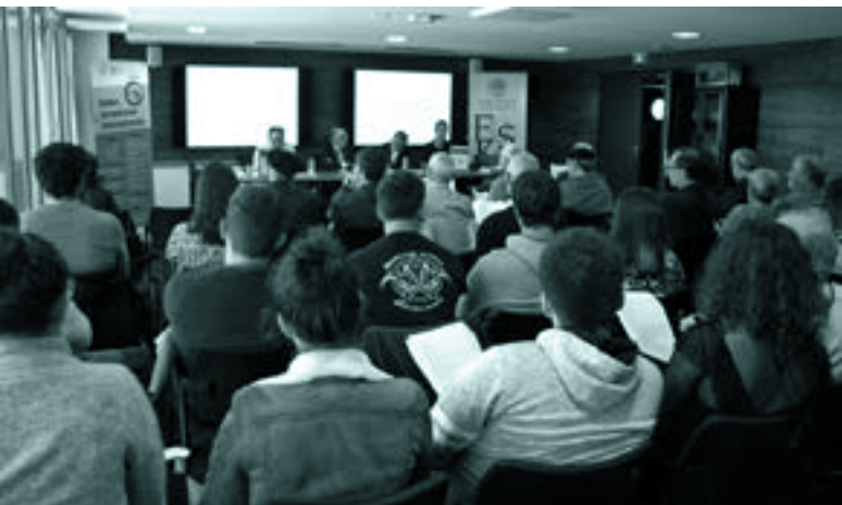
Urriaren 31n, Baionan, Euskal Hiztegi Historiko-Etimologikoaren aurkezpena