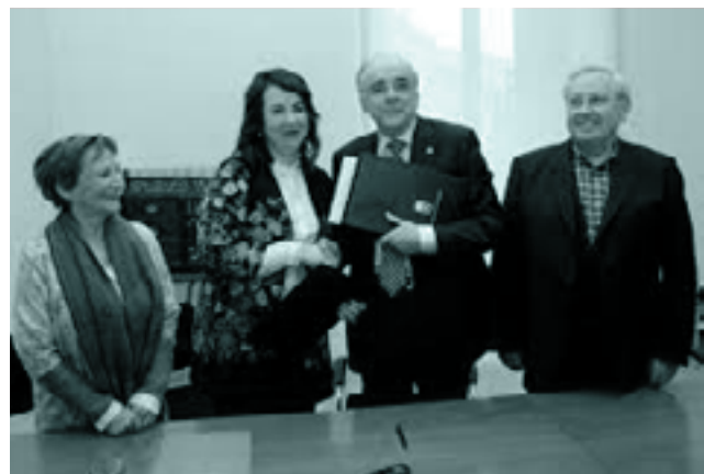
Lankidetza hitzarmena Nafarroako Parlamentuarekin