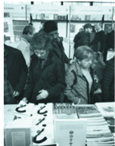
Euskaltzaindiaren saltokia Durangoko Azokan

Euskaltzaindia 54. Durangoko Azokan izan da eta, besteak beste, honako lan hauek eraman ditu bertara: Berri gogoa liburua, Euskara Batuaren Eskuliburuaren (EBE) 3. edizio berritua, zentsura jorratzen duen Euskera agerkariaren 63 (2-2) zenbakia, Erlea 12 , Euskaltzaindia , euskararen 100 urteko laguna komikia, Euskal Hiztegi Historiko-Etimologikoa (EHHE-200), Azkue Literatura sarietako irabazleen ipuin eta olerkiak biltzen dituen liburua.