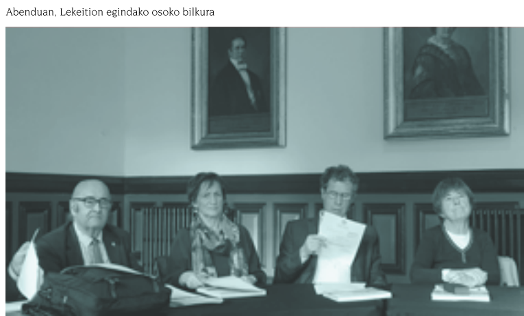
Abenduan, Lekeition egindako osoko bilkura