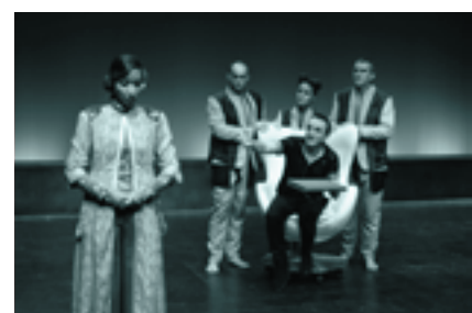
Ghero antzerki emanaldia