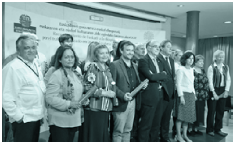
Urrian, egoitzan euskal diasporari egindako omenaldia