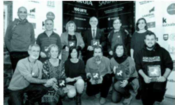
Urtarrilean, Argia Saria jasotzeko ekitaldia