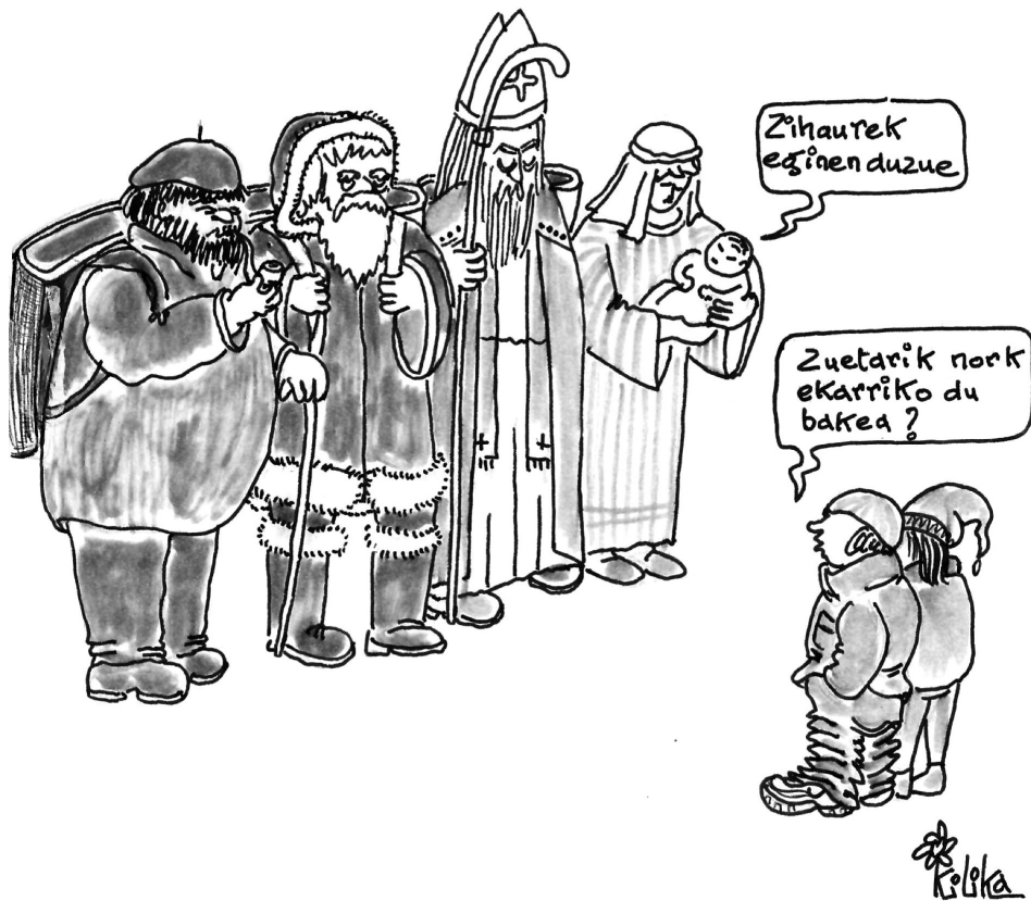
Mixel Oronos «Kilika» marrazkilariak Herria astekarian agerturiko marrazkia (2635. zenbakia, 2001/12/20)