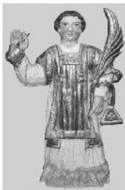
Mahasti Zainen patroina 2011