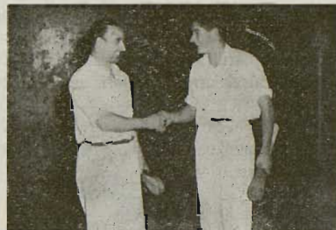
AMOREBIETA IV ta OROZ I

—Bai, benetan izan zan tamalgarria pe-lota-zalientzat eta pelotarentzat be, zuk ain gazterik joko kementsu ori itxi bearra. Zeintzuk izan dira euki dozuzan aurkalari edo kontario gogorrenak pelotan?