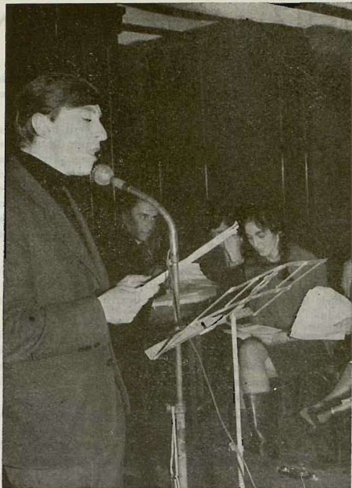
Pumanieska'n. III Euskal Abesti Barrien Sariketarako saio bat egiten

Bear ez doguna da, urgeldia eta ustela: urgeldiak, egonean egonean, azkenean, ugaraixoen «kra, kra, kra» abesti zarra besterik ez dau sortzen. Mendietan jaiotako ur biziak barriz, goi aldetan gozo, meloditsu abestuko dau, errietako zubipetik igarotzerakoan indartsuago, eta