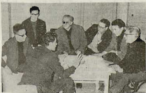
«Eleiz barruan zuzentasuna gura dogun»

Eleizeak pertsonaren askatasuna beti yagon dau. Pertsonari bere gizatasunetik yatorcion doaia, Eleizeak ezin dau zapaldu ta ukatu. Ta, konzilioak Eleizako erri eritxiari buruz berba ez egin arren, askatasunatzaz egin dau, ta askatasuna da erri eritxiaren oiñarria. Konzilioak garbi agertu dau gizonaren askatasuna: askatasuna bere kontzientziak eskatuten deutson erlijioari jarraituteko, t. a. Askatasuna ez da siñestedunen eskubide berezia, gizon guztiena baiño. Gizon guztiok egi egarri gara ta egiaren atzetik goaz, baiña orretarako gizonak askatasuna bear dau. Orregaitik, Eleizeak ez dau ondo ikusten erri agintari batzuek siñestedun eta siñis bakoen artean egiten daben banaketa, giza-pertsonaren eskubideak ukatuten dabez-ta.