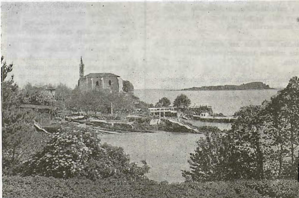
Mundakaren aurrean Izaro ugartea, ainbeste itxaslanen testigu izilla