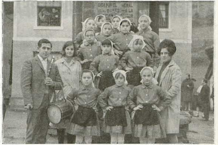
Ziortza'tar taldetxo bat igaz, San Tomas egunez

nak; gaur ezta olan. Nekazaritzan diarduenak be, len lez ez. Aurrerakuntz andiak egin dabez emen. Baserriak alkartu, lana alkarregaz egin eta arnasa artu. Pausu garrantzitsua auxe, gure etorkizunari begira. Leenago egin deutsoezanen erruz, baserritarra leku askotan eztago alkartzera. Baserritarren lepotik, ainbestek egin dabe barre leen! Baiña, nekazaritza artzen daben gazteak ikasita datoz gaur. Alako bildurra goitu, ta erriaren alde lan egiteko batzen dira alkartasunean.