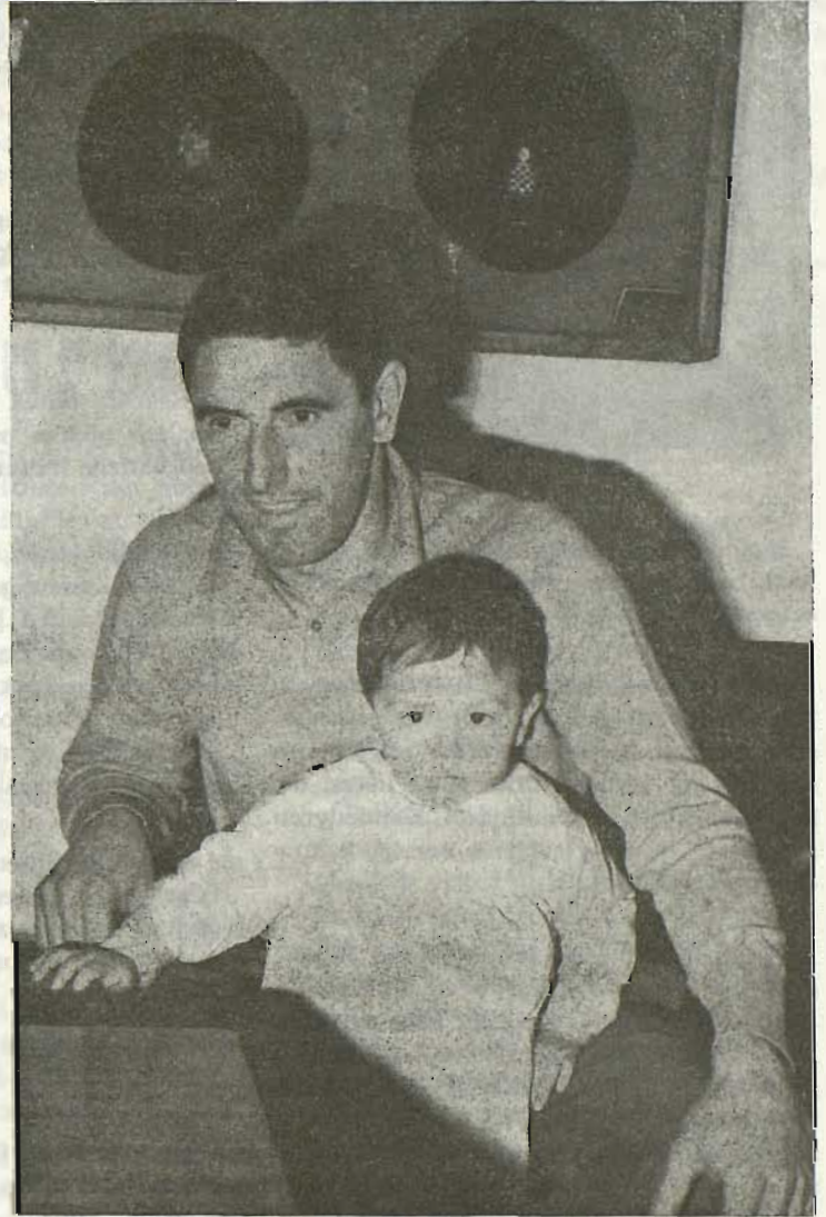
AZKARATE txapelduna bere semetxuagaz

—Aspaldion ez zabiltzala ondo dirauskue. Jakin geinke zer jazoten jatzun?