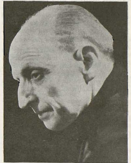
Pedro Arrupe S.J.