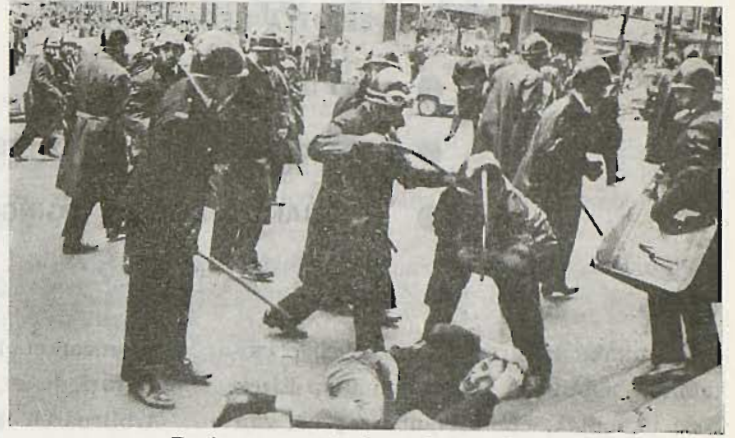
Parisen, maiatzeko zalapartak

Mediziña ikasleak, «la réforme Debré» dalakoaren bidez, erreforma berezia* euki eben euren fakultadean.