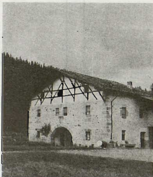
Berrizko basetxe eder bat

Andikonako Amak zainduta, erriaren alde jokatuaz, iraungo dogu bake ona lortu arte.