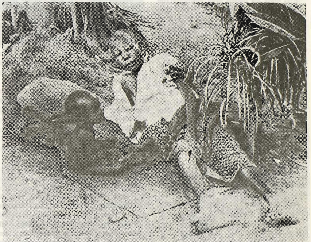
Millaka dira Biafran olako umeak, urrengo illabeteetan proteina falteagaitik ilgo direanak!

Baiña katoliku batek, beti jokatu bear dau katoliku lez; ez bakarrik Vietnameko jazoeren aurrean, baita mundu guztian gertatzen danaren aurrean bere.