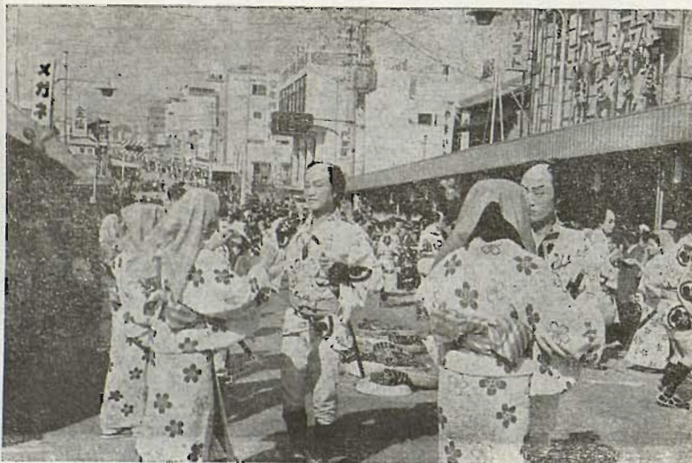
Azkenbakoak dira, Japonesak egiten dituen jaiak