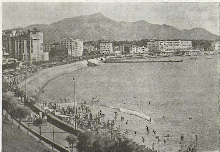
Donibane Lohitzuneko ondartzeta zoragarria

Antza danez, iñoiz baiño gatxago da gizonagan siñistea, gizarte gizontiar* baten siñistea. Proudhon'ek XIX gn. gizaldian esan ebana, eglia da gaur be: «Ez gai-tezan engaiñatu. Europa, idelaz eta ordenaz gaixo dago; indar utsaren eta printzipioen desprezioaren garaietan* sartzen ari gara».