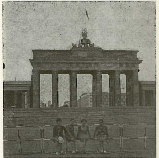
Berlingo orma lotsagarria

Berlin komunistan, propaganda asko dabil kalean: beste aldeko alemanen (federalen) kontra, amerikanoen kontra. Rusiaren alde. Vietnamen alde. Pragako «errebisionisten» aurka.