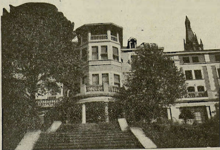
«Misionera Sekular»rak Begoñan dauken etxea

Gogoan daukogu oraindiño Frantziako "sazerdote beargiñak" egin ebena. Fabriketara eurretara joan zirean lan egiten, beargiñeri Jesukristoren Barri Ona erroteko. Be-