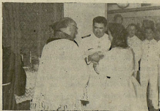
.. andra batek seintxu eder bat ekarri dau mundura. Ni bateatzaille.

Comisión Católica onck Espaiñiatik Amerikara edo andik ona, familiak osotu ta alkartuteko eroan edo ekarri dituan personak 22.000-tik gora dira. Lan ederra!