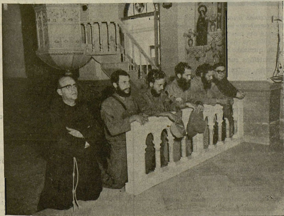
SIERRA MAESTRA-KO GUDARIAK «Gutariko geienak, katolikoak gara»

Esperantza aundiagaz eta, era batera, urduritasun ez txikiagaz begiratuten deutse etorkizunari Cuba-ko katolikoak.