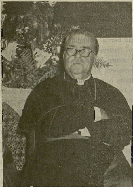
MONS. ENRIQUE PÉREZ SERANTES