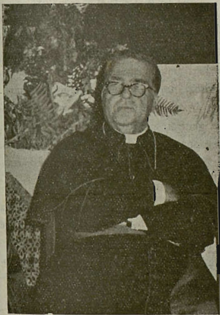
Monseñore Enrique Pérez Serantes Santiago de Cuba-ko artzobispa

Monseñore Enrique Pérez Serantes, Santiago de Cuba-ko artzobispoak, beste karta pastoral importante bat irakurri eragin dau, urriaren 2-an, bere diozesiko eleiza guztietan.