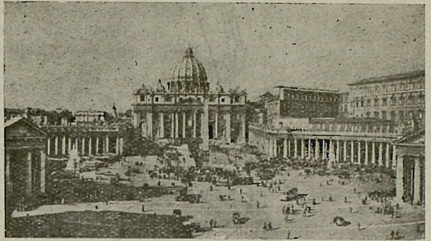
etorriko ete dira ba azkenen Erromara anglikanoak

Kantorbery'ko arzobispo Dr. Fisher'ek bere kargua ixteko erabakia artu ebanian muin asko beste herba onetxek be esan ebazan irurogeita iru urteko gizon arek: "...Nire kemena ez da makaldu, eta 'ziur nago nire buru-argitasuna geiagotuaz doia-la; baiña nire pazientzia gutxituaz doiana be badakit eta onexegaitik nik uste dot nire ordua eldu dala".