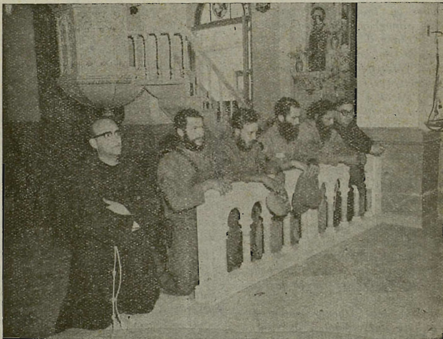
Komunistak sarritan kristiñau zinizotzat urratzen dira

5.—Komunismoa ateo da, au da, Jaungoiko bagea. Materia besterik ezpadago eta dana bada materia, ezin egon Jaungoikori ez antzekorik. Euren obligaziño gogorra da Jaungoiko eta erlijiño guztien kontra egitea. Batez be Katolizismoaren kontra, ta