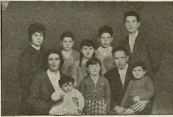
"Zure seme ori, zurea baño Jaungoikoarena da geiago".

Paris ondoko erritxo batean, 31 urteko aita batek bere semetxoia il dau. Zer dala-ta?