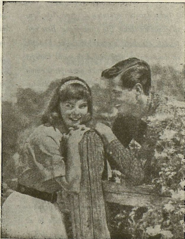
"Zenbat neska polit geratzen diran eskondu barik".