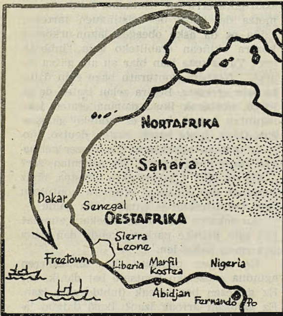
Oestafrika, euskaldun arraintzaleen bigarren bizilekua.

Naziño bakoitzekoeri igarri egiten jake arpegian. Besteen aldean, batzuk hitxura ederragoa dauke, finagoa, politagoa. Nire txoferra guztiz habilla zan, baltz guztien nazionalidadea arpez egagututeko. Bera mutil galanta zan; eta bere begitarrea baltz baltza izanarren, geurearen antzekoa zan. Gero jakin neban, bere naziñoa antigualako demporetan Nortafrikatik Sahara desertuan zear etorriko zuriakaz odolez baturu zala.