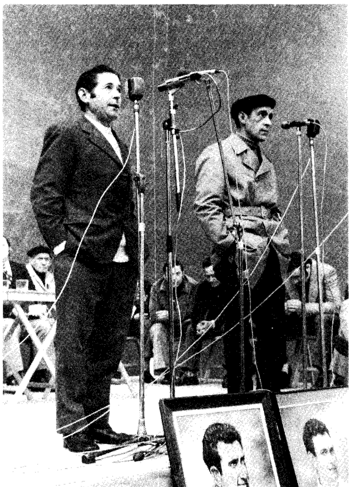
Lazkao-Txiki eta Lasarte bertso kantari, Azpeitian.