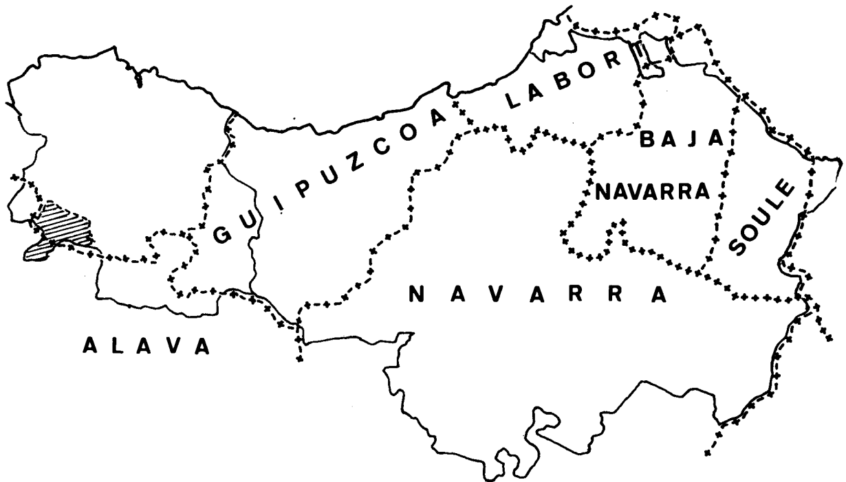
Situación de la variedad de Orozco, en el dialecto vizcaíno y en el conjunto de la zona vascofona.