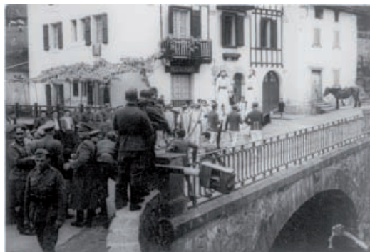
Pekotxetako auzoa. Arnegi.