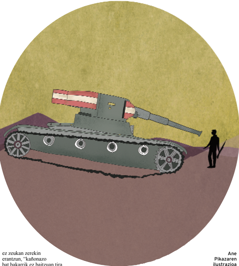
Ane Pikazaren ilustrazioa

Hirugarren egunean, ostera, lai-noa barik argitasuna nagusitu zen, faxisten hegazkinen mesederako. Alkainek idatzi zuenez, "hasi dira abioiak eten gabe bonbak tira eta tira. Baita beren artilleri guzia ere, eta ocho con ocho txarrena, fusillarekin bezin azkar tiratzen baituzten". Artxandako defentsak